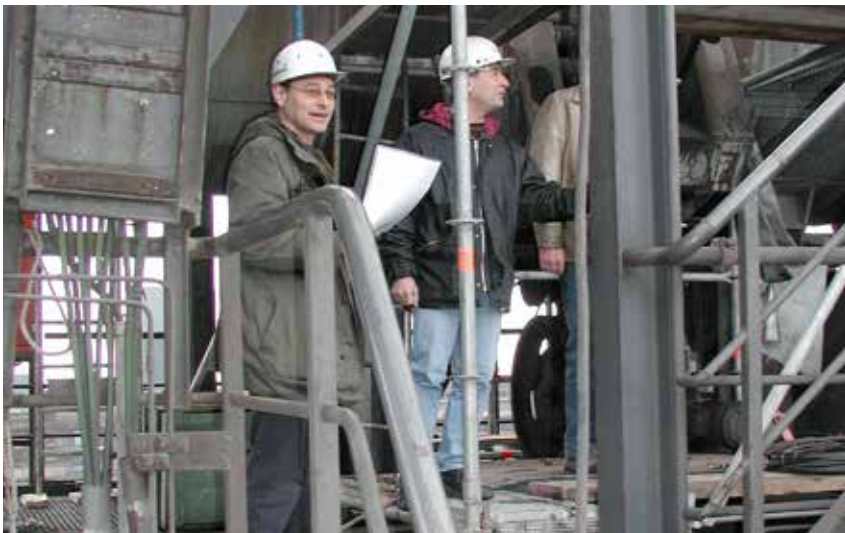
Bild 2-2: Einweisung des Verantwortlichen der Fremdfirma durch den Auftragsverantwortlichen

Die Einweisung sollte in einem Protokoll dokumentiert werden (Beispiel Anhang 3). Im Einweisungsprotokoll wird ausdrücklich auf die Pflicht des Verantwortlichen der Fremdfirma hingewiesen, dass dieser die zum Einsatz kommenden Mitarbeiter der Fremdfirma nachfolgend zu unterweisen hat.