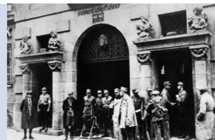
SA-Männer besetzen das Gewerkschaftshaus, Piesalozstraße in München, 1933.