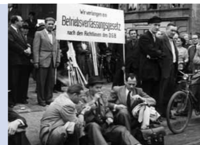
Gewerkschaftsproteste im Juli 1952