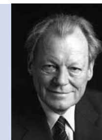
Willy Brandt © Engelbert Reinle