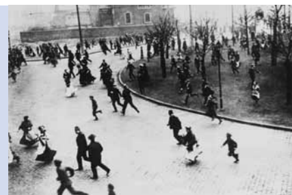
Bergbauersstreik im Ruhrgebiet, 1912

Eine weitere Geschichte, die verblüfft: Als 1918 der Krieg zu Ende ist, Deutschland hat ihn verloren, der Kaiser dankt ab, die Weimarer Republik wird ausgerufen, teilt sich die Arbeiterbe-