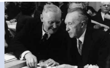
Konrad Adenauer und Hans Böckler